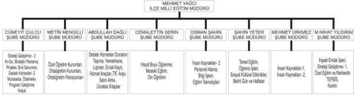
Şekil 3: İlçe Milli Eğitim Müdürlüğü Teşkilat Yapısı