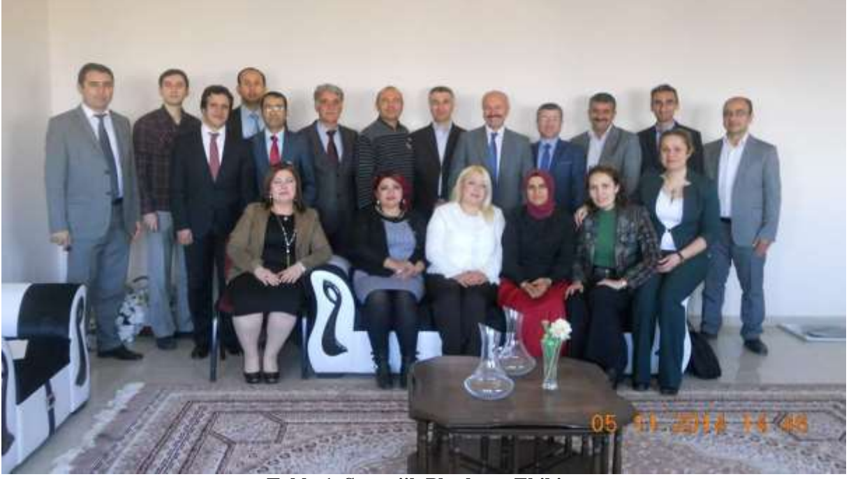
Tablo 1. Stratejik Planlama Ekibi